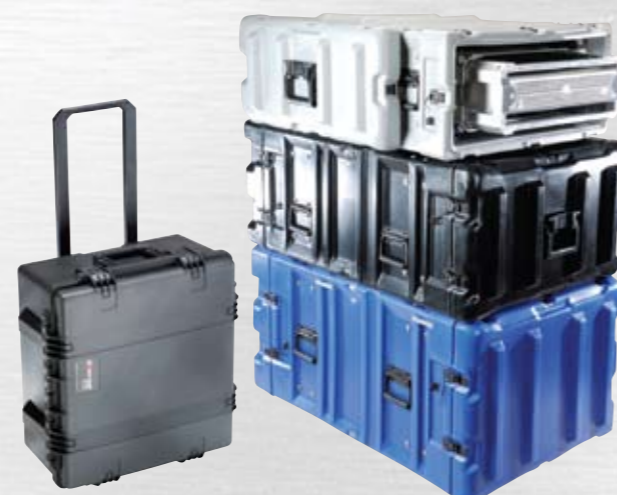
Peli Storm Case

Den største forskjellen mellom Pelicase og Peli Storm Case er at Storm benytter en fjærbelastet trykknappmekanisme, mens Peli har helmanuelle og mer robuste låseklaffer. Storm Bezel Kit panelrammesystem er i aluminium, og er basert på boring av hull i kofferten, med vanntette foringer. Skulderrem er tilgjengelig for de fleste modeller.